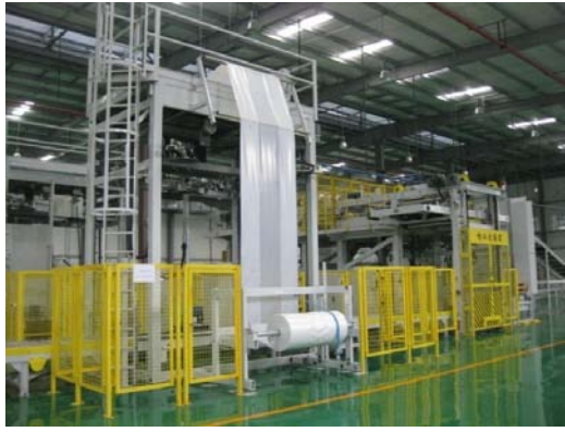
高强度冷收缩拉伸套管膜